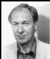
Ein Freund des Sports berät Sie in allen Küchenfragen