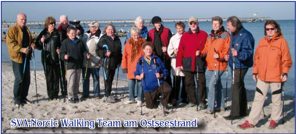
SVA-Norcic Walking Team am Ostseestrand

21037 Hamburg, Kirchwerder Elbdeich 57, Tel. 723 00 95