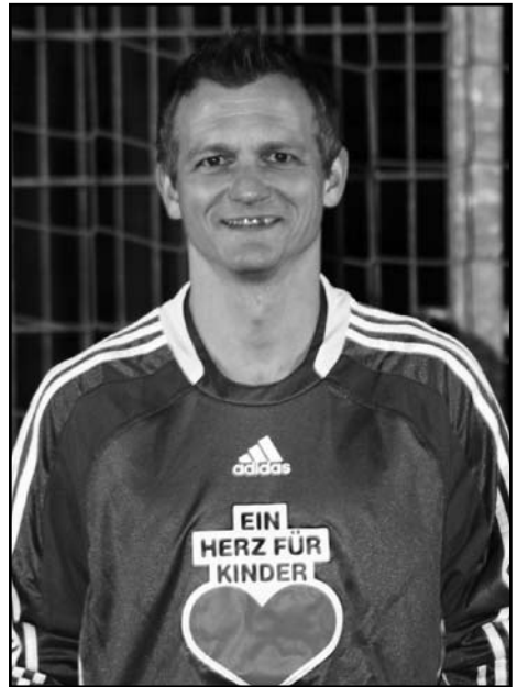
Die Alten Herren haben „Ein Herz für Kinder“

Erreichten sehr zufrieden, der dritte Platz nach der Hinrunde ist mehr als wir uns